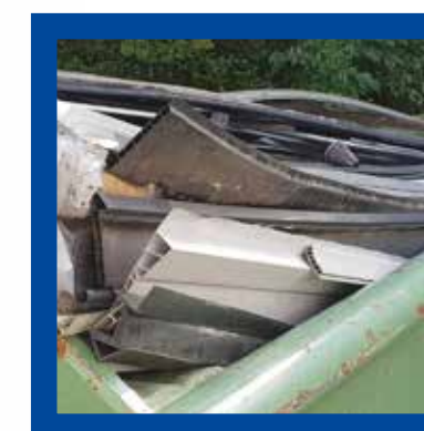
Latmateriaal in pvc