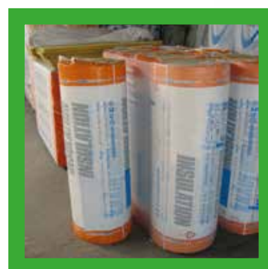
Folie rond isolatiemateriaal