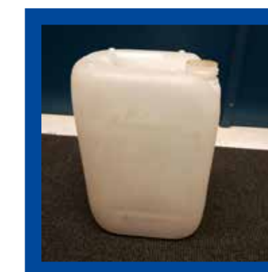
Plastic bussen en bidons