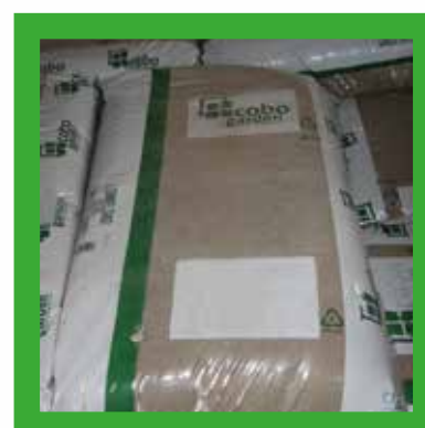
Plastic zakken van zand, keien en cement