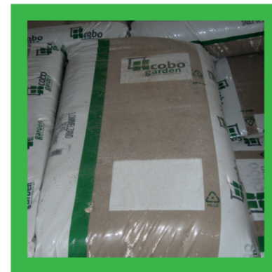
Plastic zakken van zand en keien