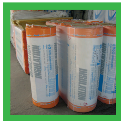
Folie rond isolatiemateriaal