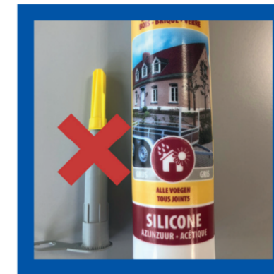
Siliconentubes zonder dop