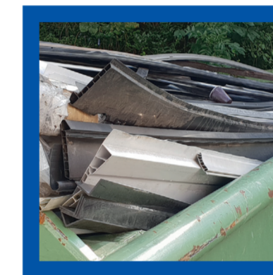
Latmateriaal in pvc